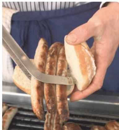
Nürnberger Spezialität: Nürnberger Bratwürstchen, hier einmal ganz einfach im Brötchen als „Drei im Weckla“

Der Messetag ist vorüber, Sie haben viele lohnende Kontakte geknüpft und möchten diese gerne beim Abendessen in fränkischem Ambiente vertiefen. Die Nürnberger Innenstadt und Altstadt, nur wenige Fahrminuten vom Messegelände entfernt, hält ein großes Angebot an Cafés, Restaurants, Kneipen und Bars bereit. An dieser Stelle möchten wir Ihnen einige Empfehlungen mit auf den Weg geben.